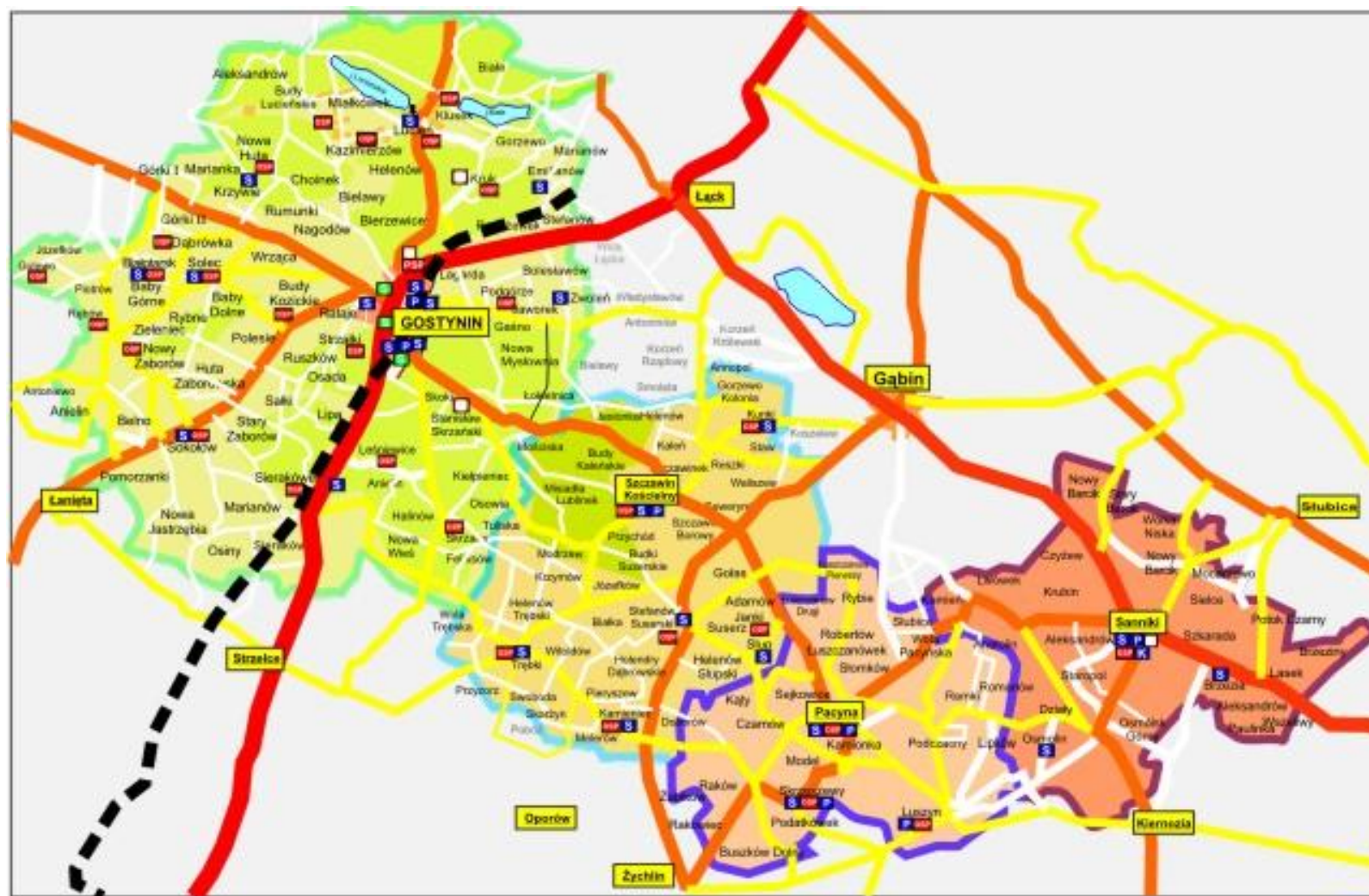
Rysunek 2. Mapa powiatu gostynińskiego