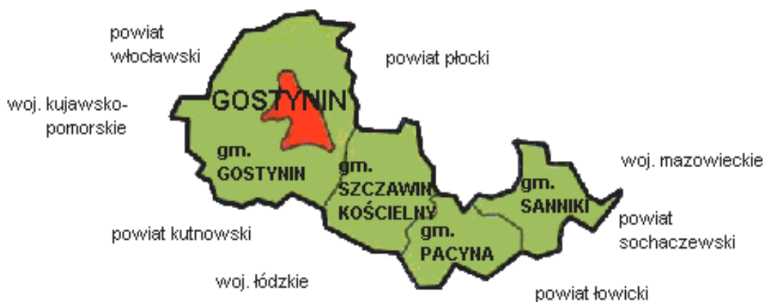
Rysunek 1. Położenie miasta Gostynin w powiecie gostynińskim.

Malowniczo położone tereny, czyste środowisko naturalne, bogactwo fauny i flory Gostynina tworzą sprzyjające warunki dla turystów szukających odpoczynku i relaksu poprzez kontakt z przyrodą.