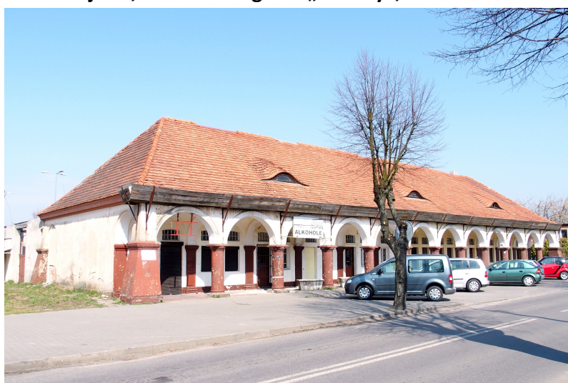
Zdjęcie nr 8. Jatki miejskie, ob. hale targowe „Arkady”, ul. Floriańska 23

Wzniesione w około 1924 r. przez kupców gostyńskich. Obszerny, parterowy budynek nakryty wysokim, czterospadowym dachem, z frontową połącią wspartą na rzędzie okrągłolucznych arkad, wydzielających frontowy, przesklepiony podcień. Gurty sklepienne spływają na kolumny i pilastry przyścienne wydzielające pary otworów z nadświetlem: dwa okna lub okno i drzwi. Kolumny niskie z tokańskimi kapitelami, archiwolty arkad profilowane w tynku. W narożach podcienia - filary. We frontowej połąci dachu okna powiekowe.