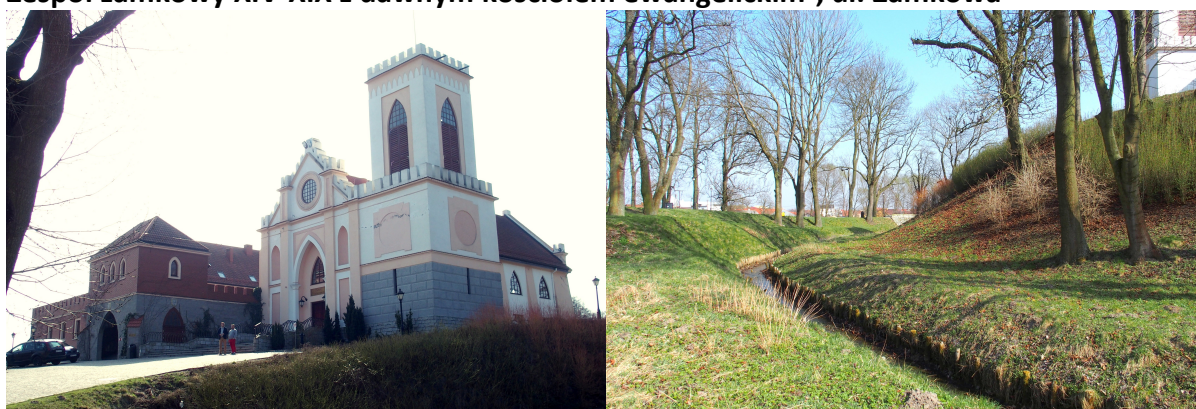
Zdjęcia nr 1, 2. Zespół zamkowy XIV-XIX z dawnym kościołem ewangelickim, ul. Zamkowa

Zespół pochodzi z 4 ćw. XIV w., przebudowany 1513 - 1532, zdewastowany w XVIII w., gruntownie przebudowany na kościół ewangelicki w latach 1824 - 1830, adaptacja i remont od 1979 r., przebudowa 2009 r.