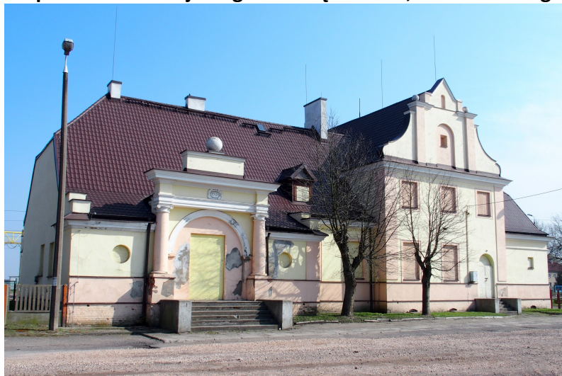
Zdjęcie nr 3. Dworzec kolejowy, ul. Słowackiego