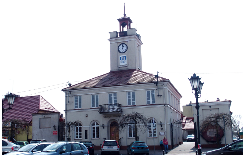
Zdjęcie nr 5. Ratusz, ul. Rynek 1

Budynek klasycystyczny wybudowany w latach 1821 - 1824, według projektu Hilarego Szpilowskiego. Remontowany w 1997 r. Budynek murowany, tynkowany, zbudowany na planie kwadratu, dwukondygnacyjny, nakryty czterospadowym dachem zwieńczonym kwadratową w przekroju wieżą zegarową z ażurową latarnią ujętą galeryjką. Kondygnacje rozdzielone gzymsem podokiennym piętra, w zwieńczeniu ściany fryz wydzielony linearnym gzymsem i wyładowany gzyms okapowy. W dolnej kondygnacji wysokie okna zamknięte