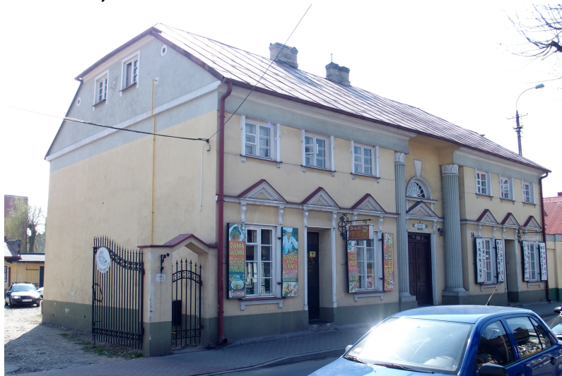
Zdjęcie nr 11. Kamienica, ul. Floriańska 14

Zbudowana w 1828 r. Dwukondygnacyjny budynek nakryty naczółkowym dachem, murowany, tynkowany. Kondygnacje rozdzielone gzymsem kordonowym. Na osi fasady płytki, wgłębny portyk wsparty na dwóch kanelowanych kolumnach w porządku wielkim, z głowicami dekorowanymi motywem palmy. Między kolumnami prostokątny otwór drzwi w linearnym portalu zwieńczonym trójkątnym naczółkiem, wspartym na parze wolutowych konsolk oraz półkoliste nadświetle w opasce ze zwornikiem w kluczu. Po bokach, w dolnej kondygnacji - drzwi flankowane parą okien; otwory w linearnych opaskach przechodzących z konsolki wspierające trójkątne naczółki osadzone na gzymsie. W górnej kondygnacji okna niższe, po bokach ujęte w opaski z górnymi uszakami, zwieńczone pasem gładkiego fryzu. W zwieńczeniu ścian wyładowany gzyms.