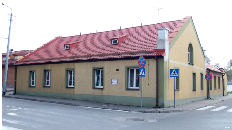
Zdjęcie nr 12. Cerkiew pw. św. Mikołaja , ob. budynek mieszkalny, ul. 3 Maja 27

Powstała w 1890 r. Parterowy budynek murowany, nakryty dwuspadowym dachem, o zmodernizowanych elewacjach. Budynek o wartości historycznej. Na strychu zachowały się polichromie o tematyce historycznej i religijnej.