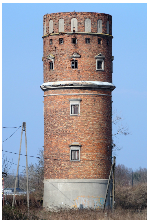
Zdjęcie nr 4. Wieża ciśnień w zespole dworca kolejowego, ul. Słowackiego

Zespół pochodzi z 1924 r. - zabytek techniki. Zbudowany równocześnie z linią kolejową Kutno - Płock. Pierwotnie zespół obejmował: budynek dworca, magazyn towarowy, wagę towarową, trzy domy mieszkalne dla pracowników, hydrant przeciwpożarowy, wieżę ciśnień oraz drewniane nastawnie. Teren pod budowę stacji i potrzebny budulec (drewno) przekazało miasto. Wieża ciśnień miała cel użytkowy, służyła do zasilania parowozów w wodę, kompleksu mieszkaniowego (nie do spożycia) i hydrantu. Natomiast kutnowska cukrownia „Konstancja”, należąca do Warszawskiego Towarzystwa Fabryk Cukru, zbudowała tu bocznice o długości 175 m służącą do załadunku buraków cukrowych.