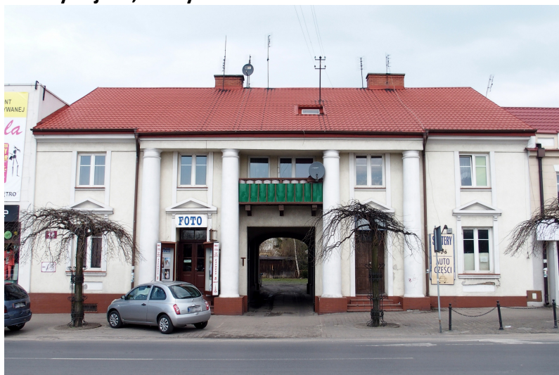
Zdjęcie nr 7. Dawny zajazd, ul. Rynek 16

Pochodzi z ok. 1824 r. Pierwszym właścicielem zajazdu był Norbert Wasilewski, potem jego zięć Paweł Rystoff z Wiączemina. Budynek klasycystyczny, murowany z cegły, tynkowany, dwukondygnacyjny, nakryty dwuspadowym dachem. Cztery środkowe osie fasady rozdzielone wysuniętymi ryzalitowo kolumnami w porządku wielkim, dźwigającymi płytki, wysunięty ryzalitowo okap. Osie okienne ujęte we wspólne listwowe obramienia, otwory okien i drzwi prostokątne, nad otworami parteru trójkątne szczyty. W osi środkowej, nad bramą wjazdową - balkon, w osiach sąsiednich - drzwi dostępne po schodkach. 9