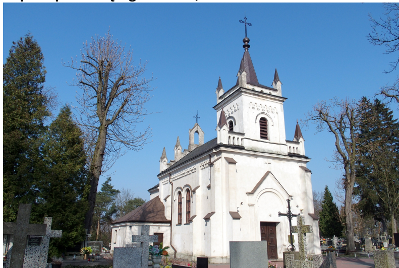
Zdjęcie nr 6. Kaplica pw. Świętego Jakuba, ul. Ostatnia

Neoromańska kaplica wzniesiona w latach 1883 - 1886, znajduje się na cmentarzu powstałym na terenie podgrodzia dawnego grodu kasztelańskiego, na miejscu pierwotnego kościoła pw. Św. Jakuba, który uległ zniszczeniu w poł. XVIII w., w 1754 r. zbudowano nową świątynię, która też uległa zniszczeniu.