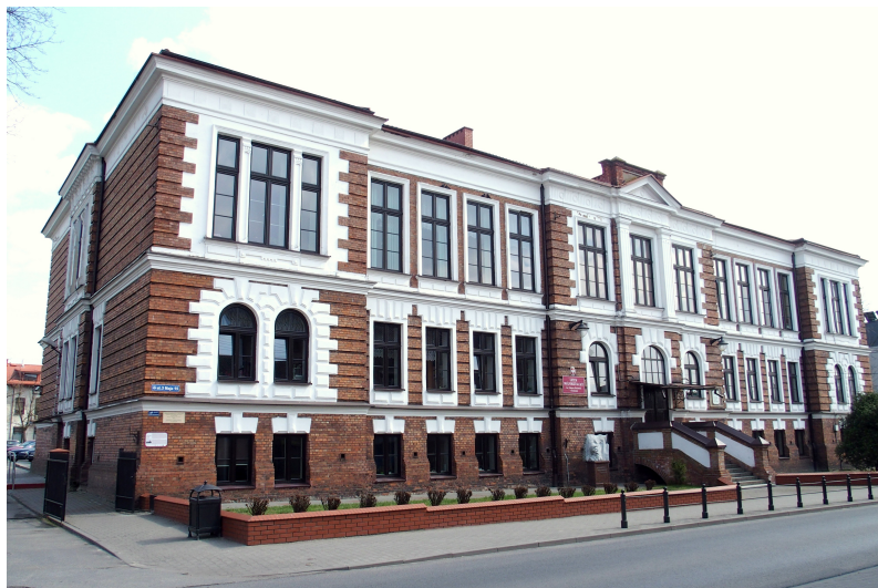
Zdjęcie nr 9. Budynek gimnazjum, ob. Liceum Ogólnokształcącego, ul. 3 Maja 15

Zbudowany w 1905 r. Wzniesiony przez wrocławską firmę Leona Bojańczyka. Począwszy od roku szkolnego 1907/1908 w budynku mieściły się dwie szkoły prywatne, od 1909 r. - półśrednia szkoła miejska, od 1911 r. - ośmioklasowe gimnazjum męskie, potem gimnazjum koedukacyjne. Gimnazjum męskie w latach 1918 - 1928 ukończyło 128 osób, a gimnazjum koedukacyjne w latach 1929 - 1939 około 240 osób. Maturę uzyskiwali nieliczni i około 45% wybrało dalsze studia.