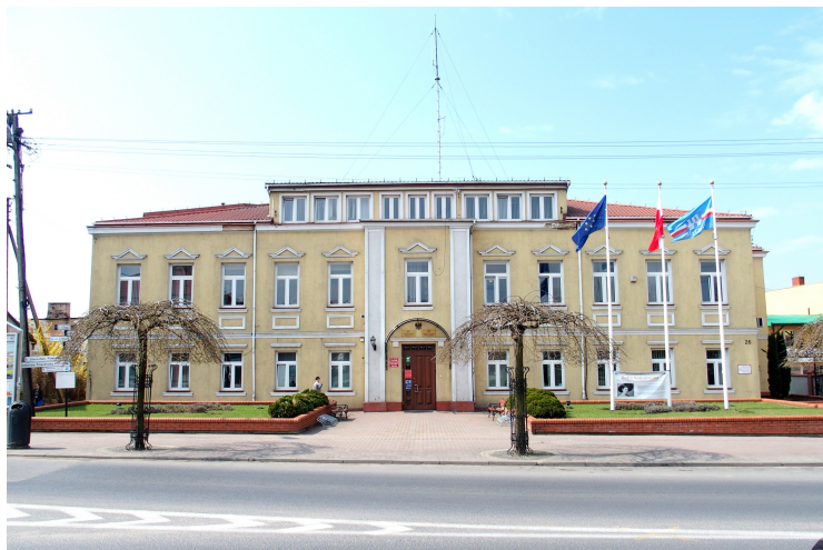
Zdjęcie nr 10. Budynek gimnazjum żeńskiego, starostwo powiatowe, ob. urząd miasta, ul. Rynek 26